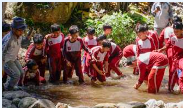
Siswa menangkap ikan di sungai untuk selanjutnya diolah dan disantap bersama-sama.