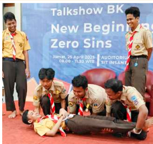
Demonstrasi PPGD oleh pelatih dari Kwartir Cabang Gerakan Pramuka Kota Bogor dalam kegiatan Kepanduan SMAIT Insantama.

Siswa kelas X dan XI SMAIT Insantama belajar simpul, pioneering , dan pertolongan pertama gawat darurat (PPGD) dalam kegiatan Kepanduan SMAIT Insantama, Rabu (30/4/2025) di dua lokasi, Kota Bogor.