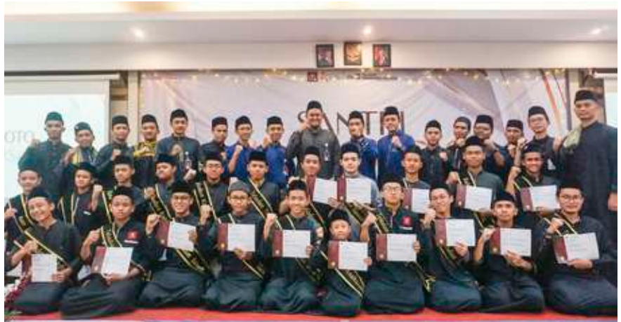
Foto bersama para pemenang nominasi Santri Award ikhwan IBS Insantama Bogor.