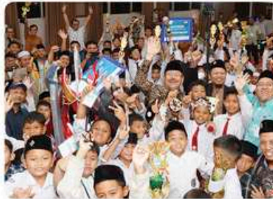
✓ Jambore Nasional Insantama Oktober - Desember 2024