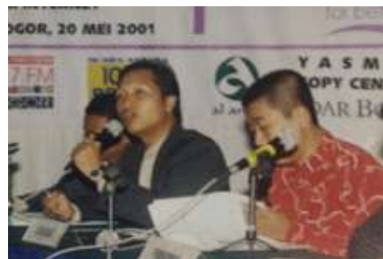
Seminar pendidikan Islam dan launching SDIT Insantama di hotel Salak Bogor, 2001.

Awal mula perjalanan ini dapat ditarik pada satu momen penting: 20 Mei 2001, di Hotel Salak, Bogor. Pada hari itulah, Yayasan Insantama Cendekia (YIC) meluncurkan secara resmi SDIT Insantama dalam sebuah acara seminar