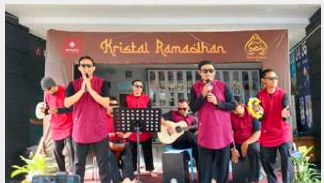
Penampilan TDV di plaza SMPIT Insantama Bogor dalam acara penyambutan siswa.