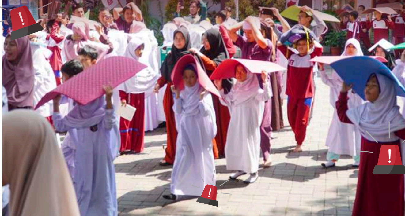
Suasana ketika mitigasi bencana gempa bumi, siswa didampingi guru berlarian menuju titik kumpul evakuasi.

“Kegiatan ini bukan sekadar simulasi, tapi bentuk nyata ikhtiar menghadapi qadha’ Allah dengan persiapan terbaik,”