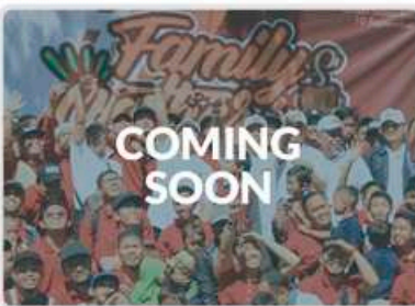
✓ Family Gathering 9 September 2025