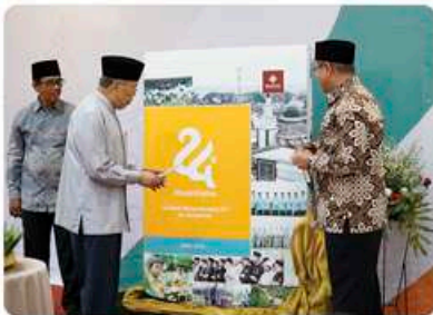
✓ Penyusunan Buku 24 Tahun Insantama Maret 2024 - Maret 2025