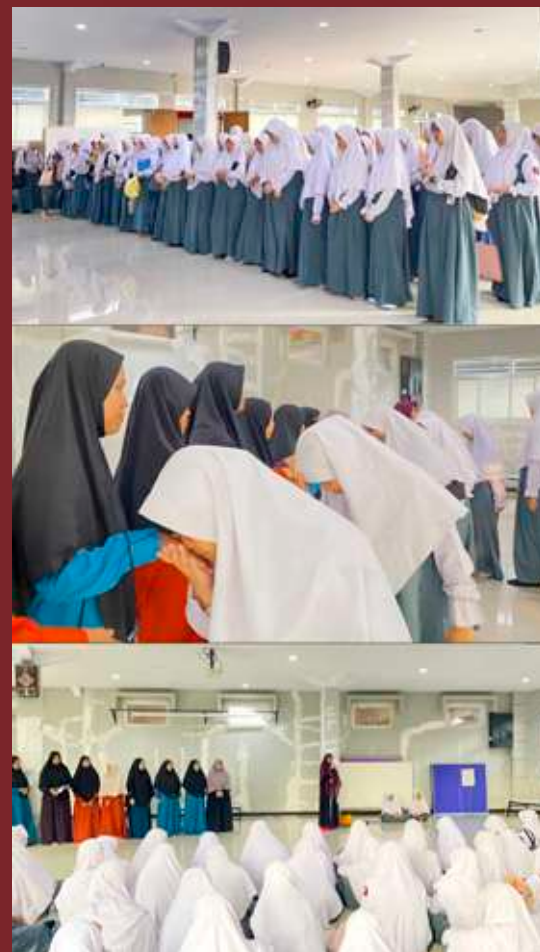
Kolase foto kegiatan rutin santri IBS Insantama Bogor.