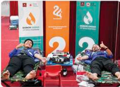
✓ Donor Darah 30 September 2024