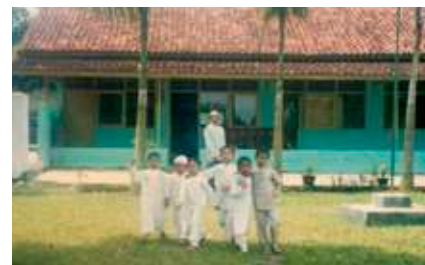
Beberapa siswa angkatan pertama sedang bercengkrama di depan gedung awal sekolah Insantama, 2001.

Menurutnya, pendidikan yang ideal itu mestinya harus bisa memenuhi tiga tujuan pendidikan sekaligus, yakni terbentuknya kepribadian ( syakhsyiyah ) Islam pada diri anak yang tercermin