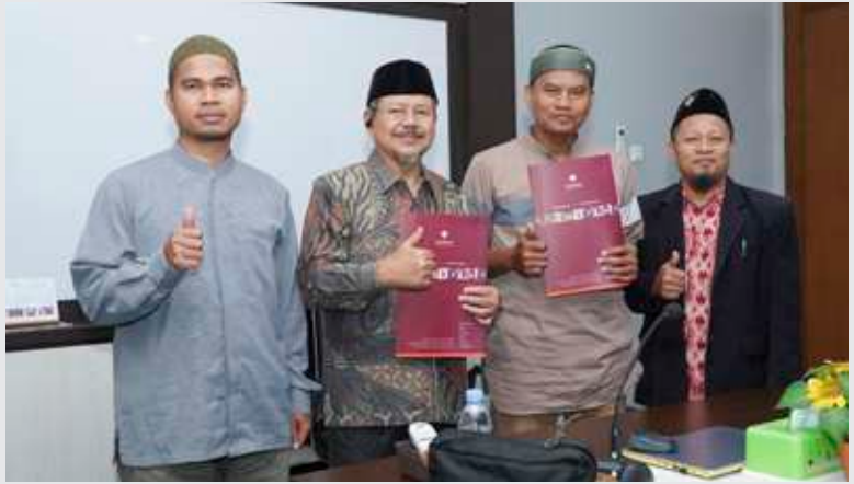
Pengurus Yayasan Bina Insan Partini menandatangani akad kerja sama pembukaan Cabang SDIT Insantama Cicalengka, Bandung Timur.

B andung Timur resmi menjadi lokasi cabang Sekolah Islam Terpadu (SIT) Insantama ke-23, Senin (12/5/2025). Peresmian ini menyusul datangnya lima pengurus Yayasan Bina Insan Partini (YBIP) yang berdomisili di Cicalengka, Kabupaten Bandung, di Ruang Rapat Yayasan (RRY) dan bertemu langsung dengan Ketua Yayasan Insantama Cendekia (YIC) Ustadz Muhammad Ismail Yusanto untuk menandatangani akad kerja sama pembukaan cabang SDIT Insantama.