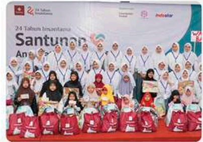
✓ Santunan Anak Yatim 8 Februari 2025