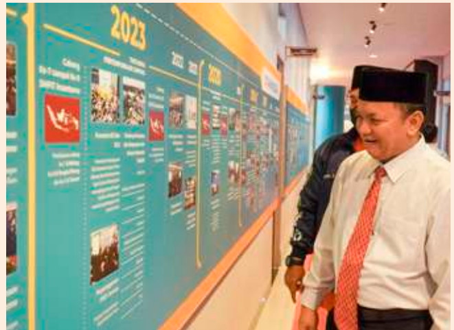
Milestone perjalanan 24 tahun Insantama terpajang di lorong teras gedung SMPIT Insantama Bogor.

Di seberang milestone , terdapat pameran beberapa benda yang memiliki nilai sejarah seperti Newsletter Kabar Insantama