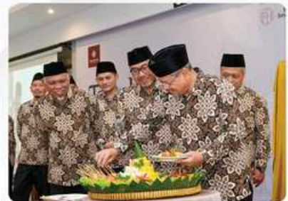
✓ Tasyakuran Akbar dan Insantama Expo 20 Mei 2025