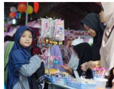
Insantama Market Day

“Anak-anak kami tidak hanya kami bekal sains dan logika, tapi juga keimanan dan kepekaan sosial. Itulah wajah pendidikan Islam yang sesungguhnya,” tutup Pak Fajar dengan senyum optimis.[] NH Tono