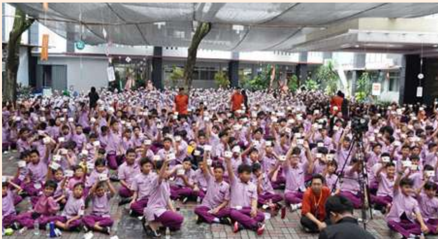
Suasana Tasyakuran Akbar 24 Tahun Insantama di area Plaza SIT Insantama.

S elain di Auditorium SIT Insantama (lantai 3), acara Tasyakuran Akbar juga diadakan di area Plaza halaman sekolah dan di kelas gedung SDIT. Sekitar 2.000 siswa dan guru memadati lokasi bagian bawah.