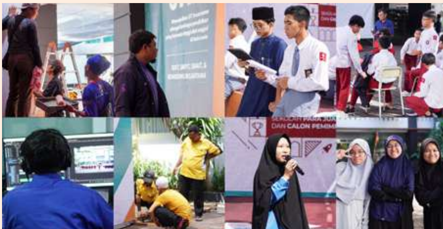
kolase foto beberapa panitia dalam mempersiapkan Tasyakuran 24 Tahun Insantama.

Tidak ada acara yang mengesankan kecuali di balik itu ada kerja sama, kerja cerdas, dan pengorbanan yang melibatkan berbagai sumber daya, baik manusia, organisasi, relasi, dan finansial.