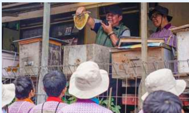
Belajar mengenali potensi desa, salah satunya peternakan lebah madu.