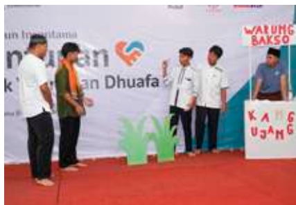
Penampilan teatrikal siswa SMAIT Insantama Bogor menghibur peserta santunan yatim dan dhuafa di panggung auditorium SIT Insantama.

Seratus anak yatim dan dhuafa yang masih duduk di bangku TK dan SD di lingkungan sekitar SIT Insantama mengikuti acara santunan yang dikemas dalam acara teatrikal Ada Inspirasi dari Aksi dan Sketsa (Adidas) dalam rangkaian acara Pesantren Ramadhan Insantama (Permadani) yang diselenggarakan SMAIT Insantama, Senin (17/3/2025) di Auditorium SIT Insantama.