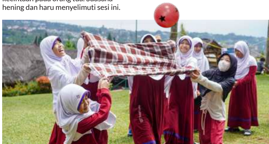
Keseruan siswa mengikuti kegiatan Outbond Mabit Ramadhan.

“Saya senang melihat siswa-siswanya sopan. Insyaallah mereka akan menjadi generasi penerus umat dan bangsa yang baik,” pungkasnya.[] NH Tono