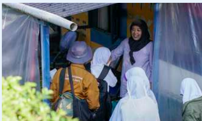
Siswa berinteraksi dengan pemilik rumah yang akan mereka tempati selama Leadchamps di Kampung Batik.

Kegiatan yang tak kalah seru adalah menangkap ikan di sungai bersama teman. Ini menjadi sarana belajar sabar, berani, dan mandiri. Ikan tak hanya ditangkap, tapi langsung dibersihkan sendiri, dimasak dan dimakan bersama-sama di alam terbuka. Maka, LeadChamps 1 adalah latihan kepemimpinan dasar yang komplet dan menyenangkan untuk menyiapkan siswa menjadi pemimpin masa depan yang hebat.[]