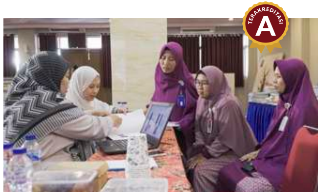
Tanya jawab asesor BANPT dengan perwakilan guru dalam kegiatan visitasi proses akreditasi SDIT Insantama Bogor, 2023.

Hasil akreditasi tersebut adalah wujud dan bukti nyata bahwa kualitas manajemen dan proses pendidikan di Insantama telah memenuhi, bahkan mendapatkan nilai unggul sesuai dengan standar nasional.